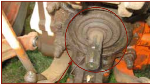
A teljesítmény leadó tengelyről hiányzik a védőharang

Mozgásban levő erő- és munkagépre fel- és leszállni nem szabad.