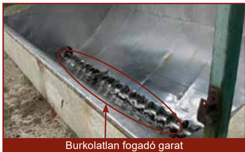
Burkolatlan fogadó garat