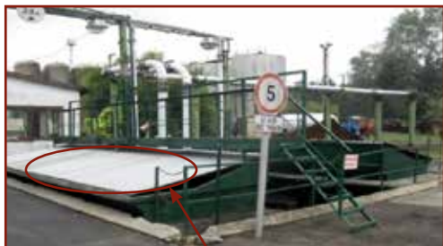
A használaton kívüli beöntő garat lefedése

Az aknák, padlócsatornák, beömlőnyílások, ledobó-nyílások, 0,8 méternél magasabban vagy mélyebben található kezelőhelyek esetében lefedéssel (akár 0,04 m-nél nem nagyobb osztásos acélráccsozattal) vagy védőkorrálattal kell védekezni a be-, leesés veszélye ellen. Részletes előírásokat további jogszabályok, a Mezőgazdasági Biztonsági Szabályzat kiadásáról szóló 16/2001. (III. 3.) FVM rendelet és a munkahelyek munkavédelmi követelményeinek minimális szintjéről szóló 3/2002. (II. 8.) SzCsM-EüM együttes rendelet tartalmazznak.