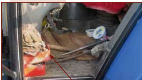
Rögzítetlenül tárolt tárgyak a kezelőfülkében

Munkagép elhagyásakor az akaratlan elmozdulást és az illetéktelen személy általi elindítást meg kell akadályozni.