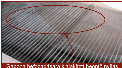
Gabona befogadására kialakított beöntő nyílás rácsozata