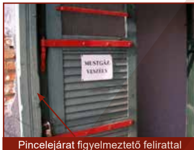
Pincelejárát figyelmeztető felirattal

A szén-dioxid színtelen, szagtalan, a levegőnél nehezebb gáz, ami a levegőt kiszorítva a pincék, üregek, helyiségek alján terül el. Nagy mennyiségben keletkezik szerves anyagok, cukortartalmú növények és gyümölcsök erjedése során is.