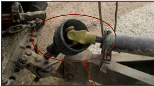
A kardántengely védőburkolata hiányos