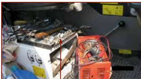
Rögzítetlenül tárolt tárgyak a kezelőfülkében