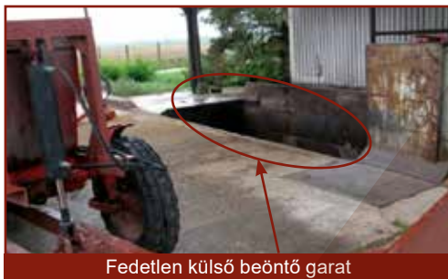
Fedetlen külső beöntő garat