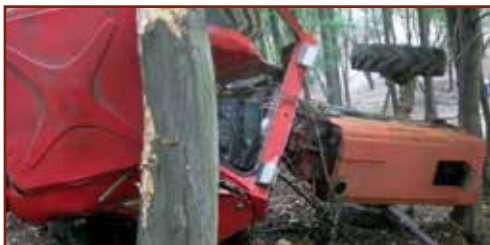
Az erdészetben használt mezőgazdasági traktor felborult, a fülkéje szétrombolódott.

Távvezérelt munkaeszközök esetében alapvető követelmény, hogy a munkaeszköznek automatikusan le kell állnia, ha az ellenőrzött vezérlési zóna határára ér. Fontos követelmény továbbá, hogy annak a távvezérelt munkaeszköznek, amely rendeltetészerű alkalmazási körülmények között a munkavállalónak ütközhet, vagy őt valaminek nekiszoríthatja, rendelkeznie kell olyan biztonsági berendezéssel, amely az összeütközés és összenyomás veszélyét kiküszöböli vagy csökkenti.