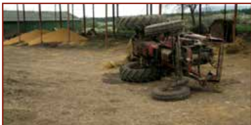
Felborult a fülke nélküli traktor. A munkavállaló a gép üléséből kizuhant, majd a gép átfordult rajta.