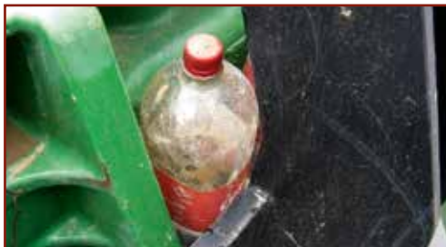
Eredetileg élelmiszerek tárolására szolgáló PET palackban veszélyes keverék tárolása

Biztosítani kell, hogy a tárolt veszélyes anyag, illetve veszélyes keverék a biztonságot, az egészséget, illetve a testi épséget ne veszélyeztesse, illetőleg a környezetet ne szennyezhesse, károsíthassa. Sajnos napjainkban is jellemző, hogy például ásványvizes vagy üdítőitalos flakonokba veszélyes anyagot/keveréket töltenek, amelyből történő véletlen fogyasztás súlyos egészségkárosodáshoz vezethet. A kémiai biztonsággal kapcsolatos további előírásokat külön jogszabályok, a kémiai kóroki tényezők hatásának kitett munkavállalók egészségének és biztonságának védelméről szóló 5/2020. (II. 6.) ITM rendelet és a kémiai biztonságról szóló 2000. évi XXV. törvény tartalmazzák.