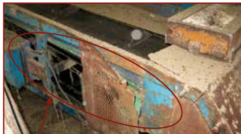
Sérült védőburkolatú szállítószalag

A munkaeszközt mindig a gyártói utasításnak megfelelően kell felállítani, használni! Biztosítani kell, hogy a kezelésekor elegendő tér álljon rendelkezésre!